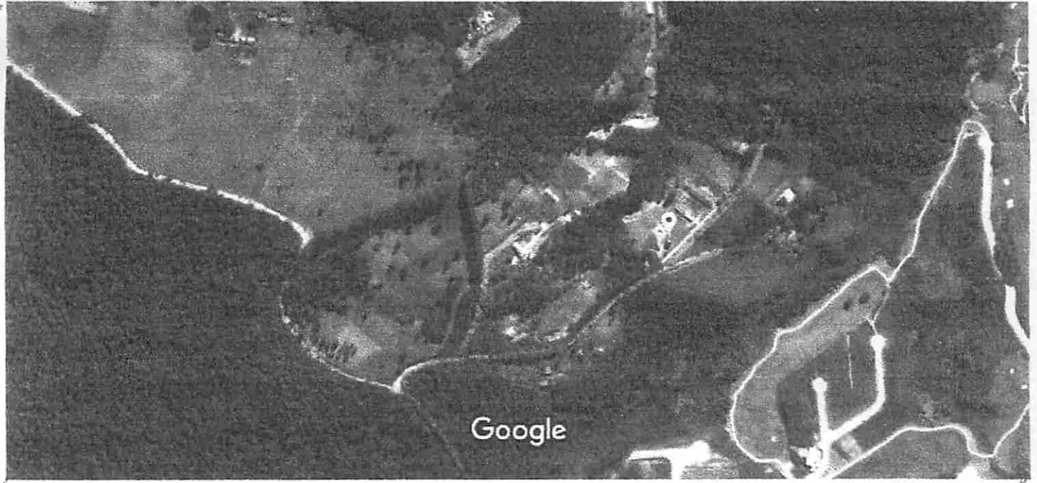
Imagens ©2016 CNES / Astrium,Dados do mapa ©2016 Google 100 m