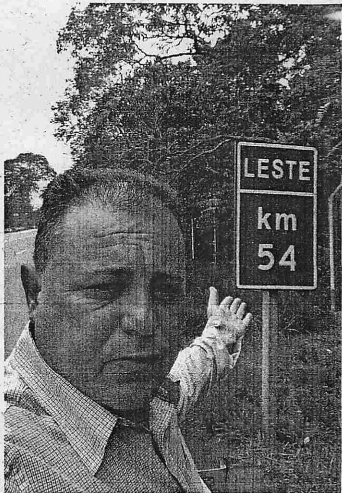
ENTRADA Vila ARRUDA