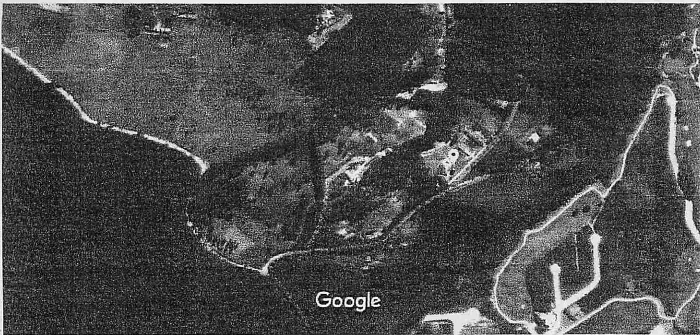
100 m