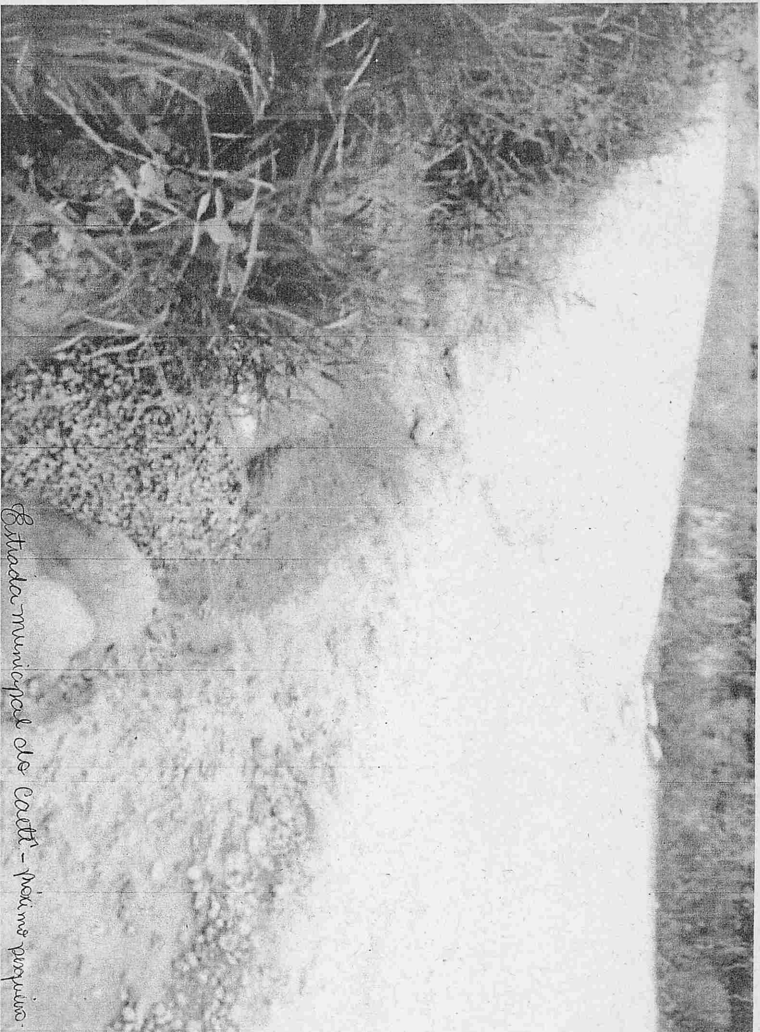
Strada municipal de Caetti - próximo poço.