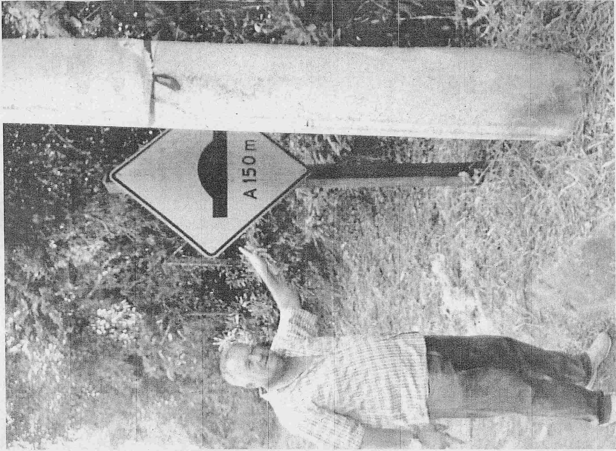
1) Estação municipal do crime - placa sinalização