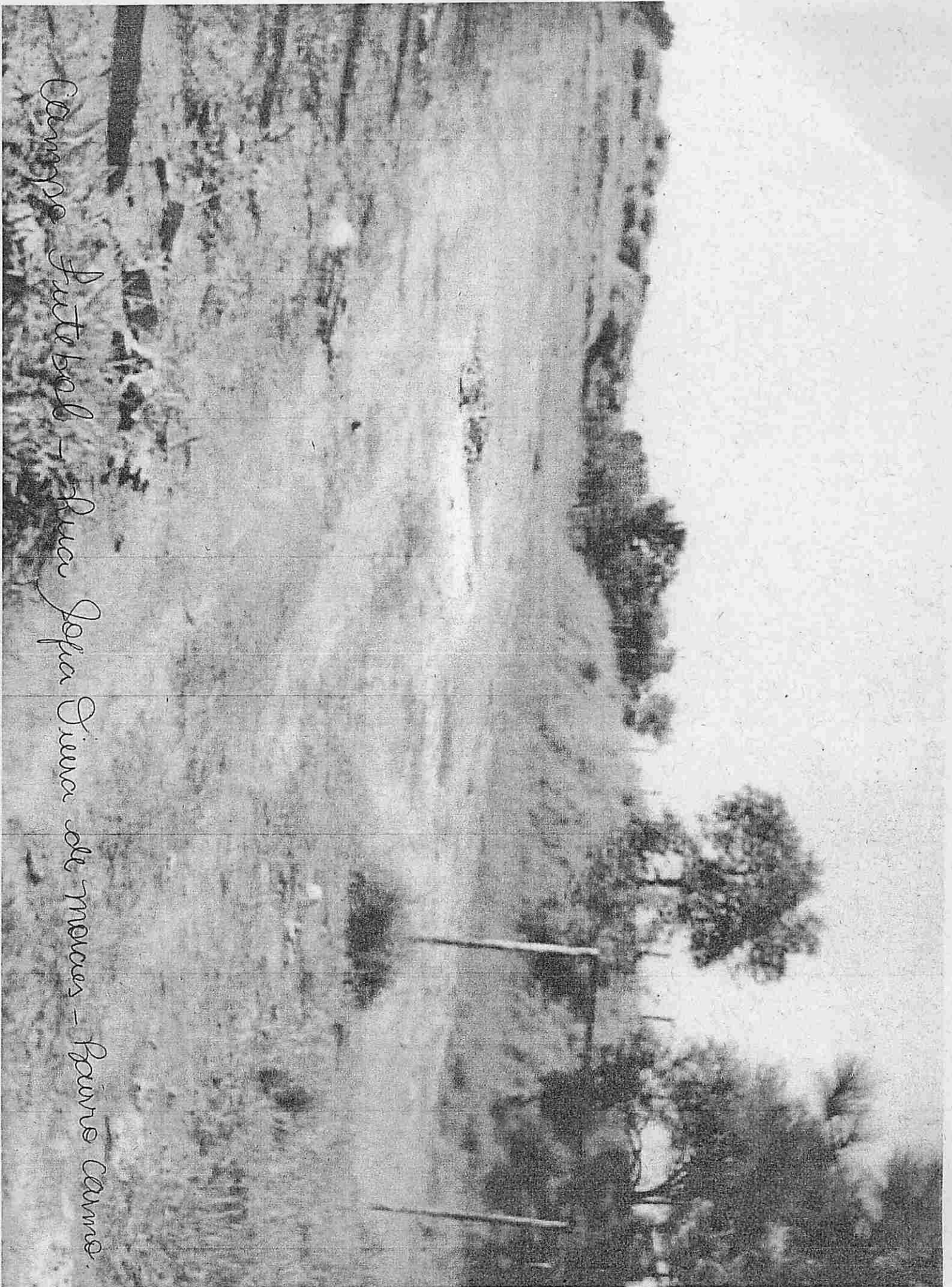
Campo futebol - Rua Jofa Dima de Moraes - Bairro Canine.