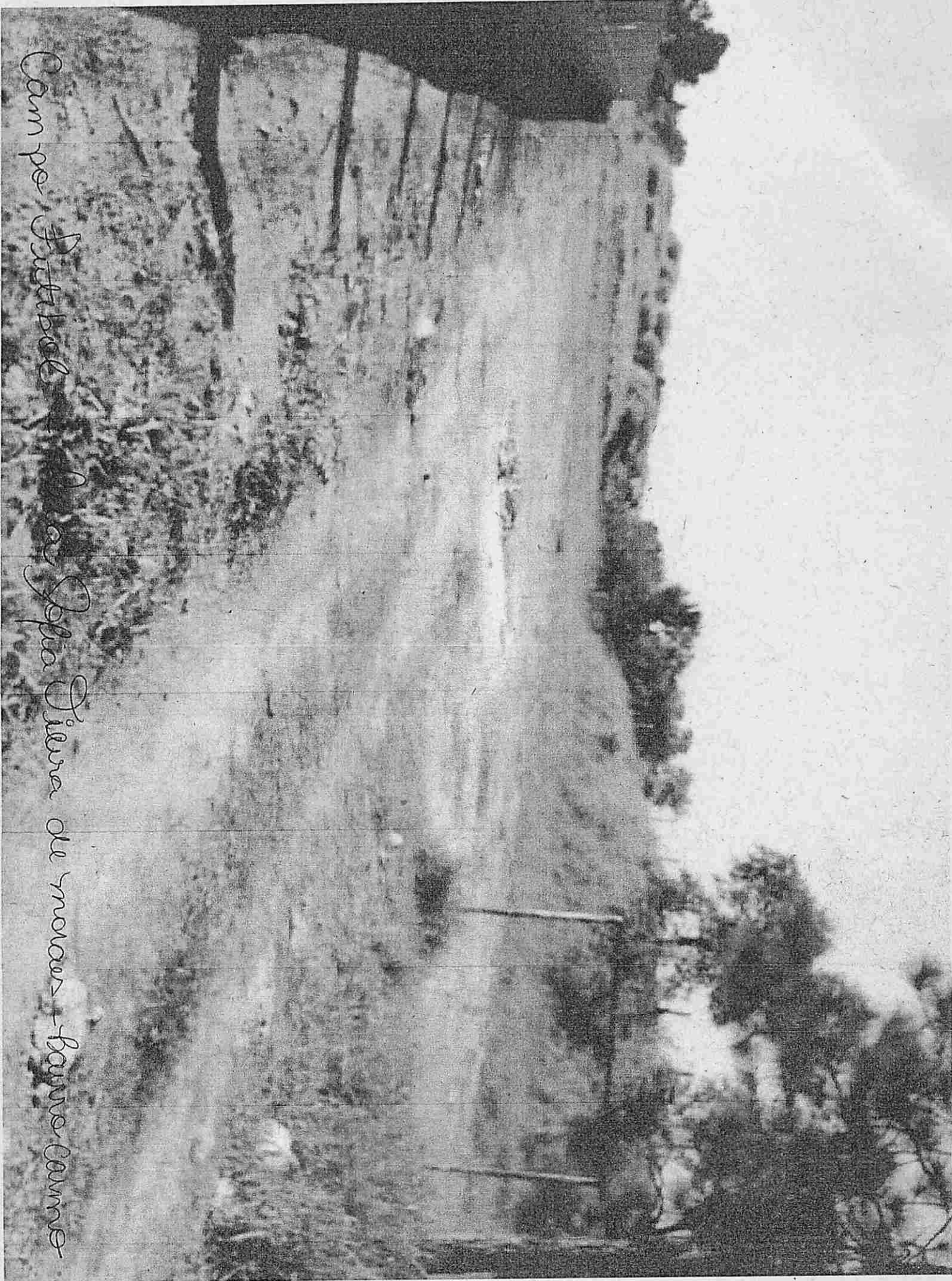
Campe Futebol - Vila Sepia - Jurema de Maracá - Bairro Coqueiros