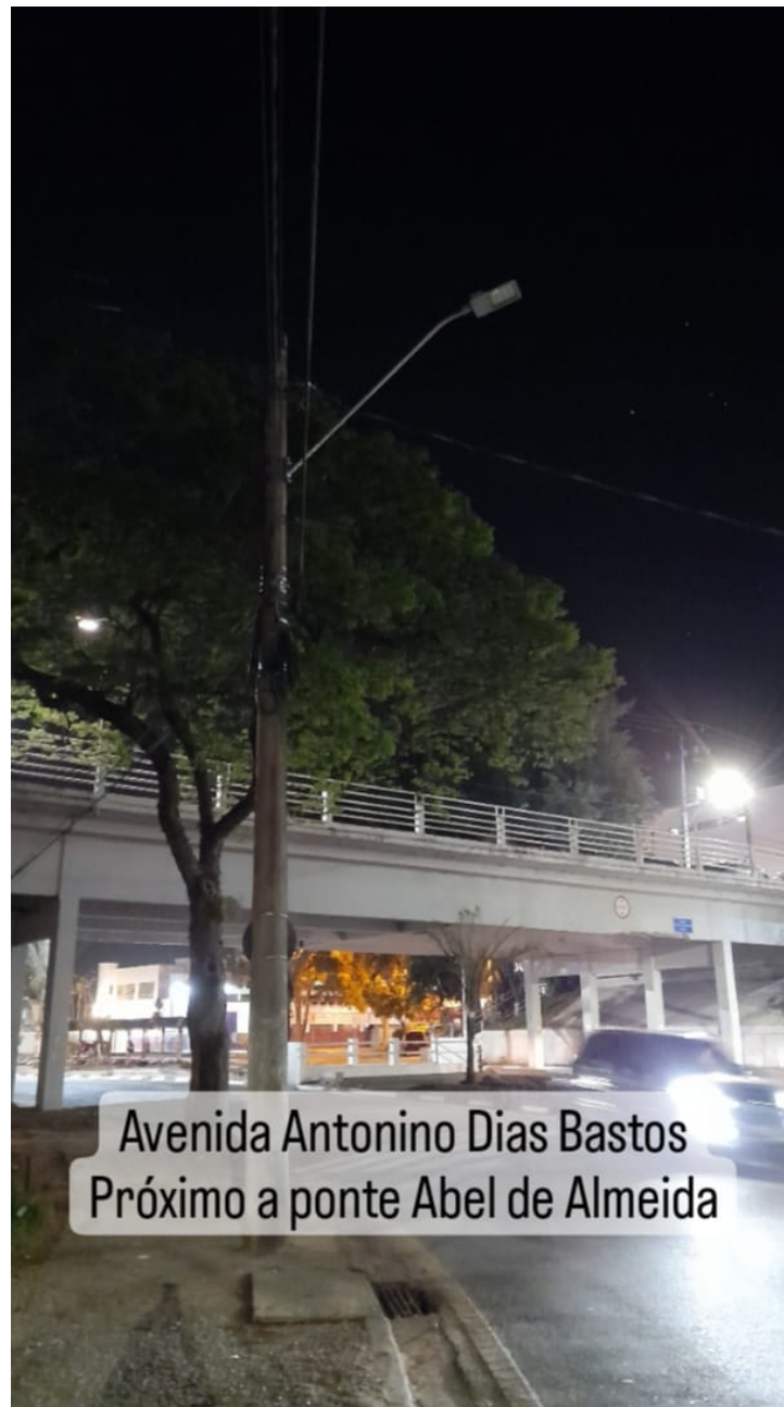
Avenida Antonino Dias Bastos Próximo a ponte Abel de Almeida

Rua São Paulo, 355 - Jd. Renê - CEP 18135-125 - Caixa Postal 80 - CEP 18130-970 CNPJ/MF: 50.804.079/0001-81 - Fone: (11) 4784-8444 - Fax: (11) 4784-8447 Site: www.camarasaoroque.sp.gov.br | E-mail: camarasaoroque@camarasaoroque.sp.gov.br São Roque - 'A Terra do Vinho e Bonita por Natureza'