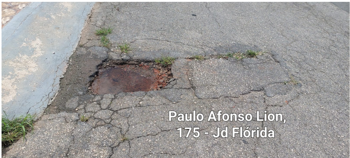
Paulo Afonso Lion, 175 - Jd Flórida

Rua São Paulo, 355 - Jd. Renê - CEP 18135-125 - Caixa Postal 80 - CEP 18130-970 CNPJ/MF: 50.804.079/0001-81 - Fone: (11) 4784-8444 - Fax: (11) 4784-8447 Site: www.camarasaoroque.sp.gov.br | E-mail: camarasaoroque@camarasaoroque.sp.gov.br São Roque - 'A Terra do Vinho e Bonita por Natureza'