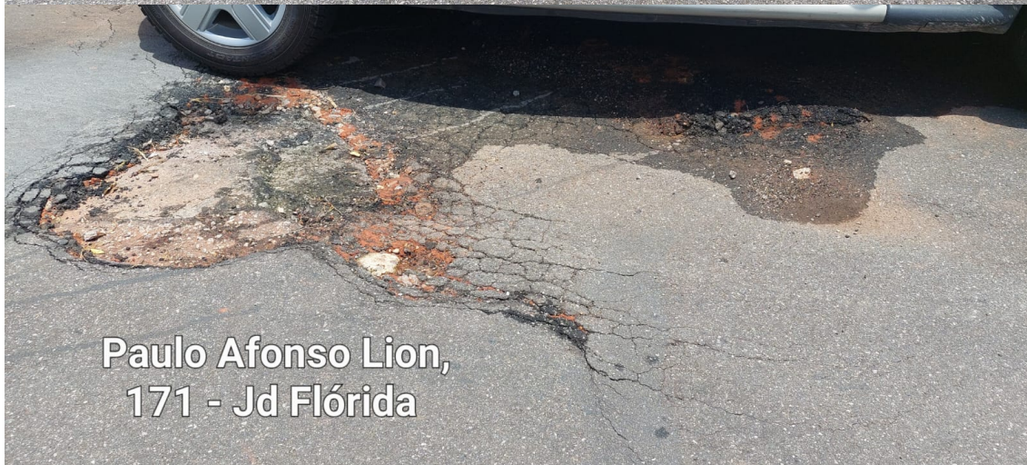
Paulo Afonso Lion, 171 - Jd Flórida