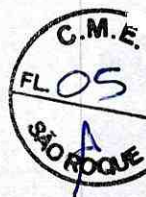
CLAUDIO JOSÉ DE GÓES PREFEITO

PREFEITURA DA ESTÂNCIA TURÍSTICA DE SÃO ROQUE, 10/09/2019