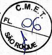
CLAUDIO JOSÉ DE GÓES PREFEITO

PREFEITURA DA ESTÂNCIA TURÍSTICA DE SÃO ROQUE, 06/05/2019