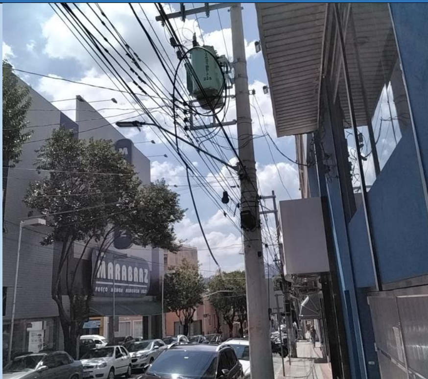
CABOS NÃO ANCORADOS, CABOS BAIXOS, CABOS ROMPIDOS, ELIMINAR CABOS MORTOS.