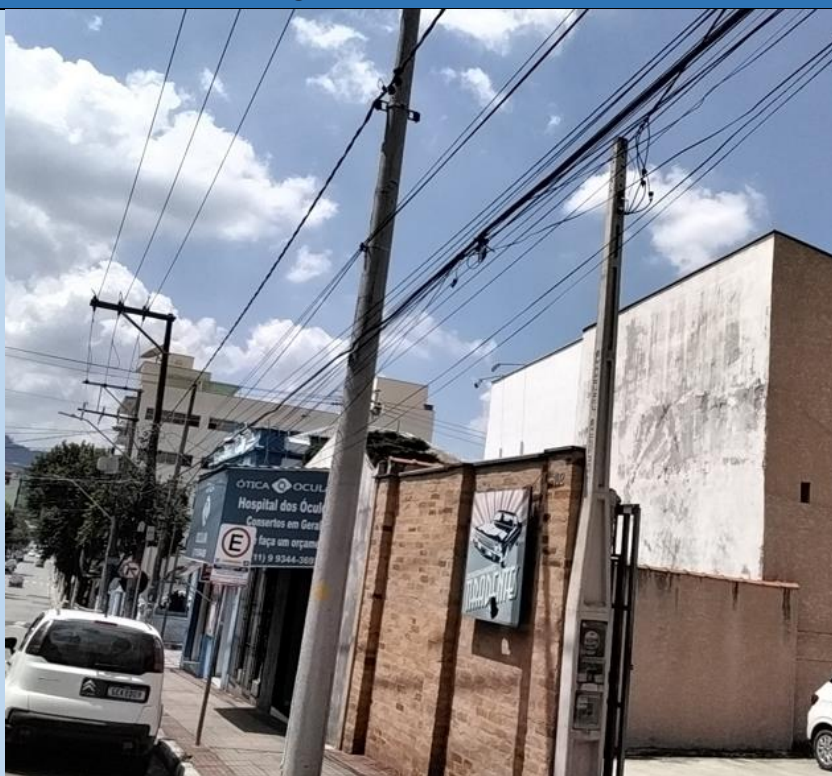
CABOS NÃO ANCORADOS, CABOS BAIXOS, ELIMINAR CABOS MORTOS.