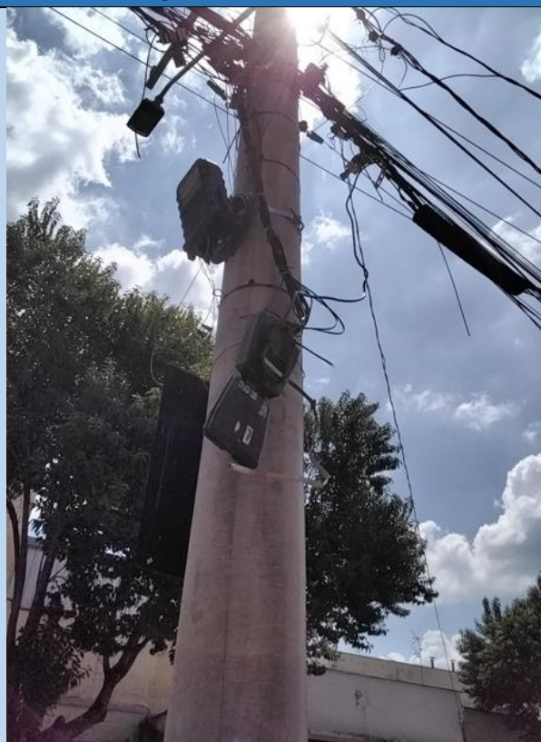
CABOS NÃO ANCORADOS, CABOS ROMPIDOS, EQUIPAMENTOS FORA DE PADRÃO