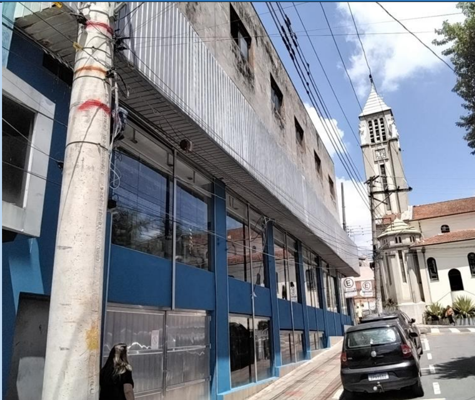
CABOS NÃO ANCORADOS, CABOS BAIXOS, CABOS ROMPIDOS, ELIMINAR CABOS MORTOS.