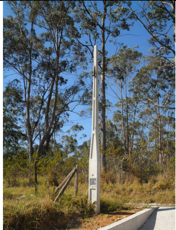
Foto 4 – No momento da vistoria não havia energização por parte da distribuidora de energia.