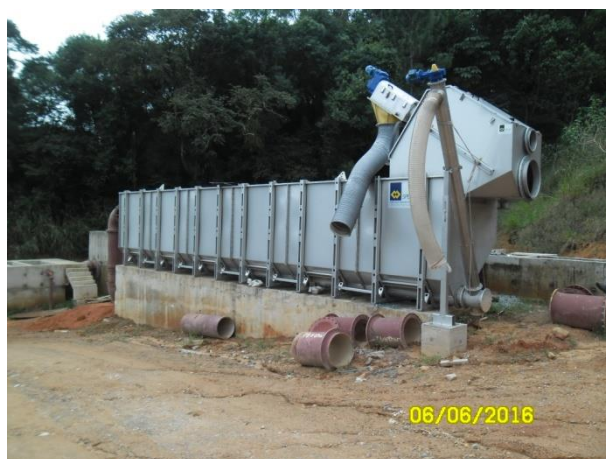
Foto 2 – Execução de obras: Sistema de Pré-Tratamento de Esgoto – Remoção de Areia.