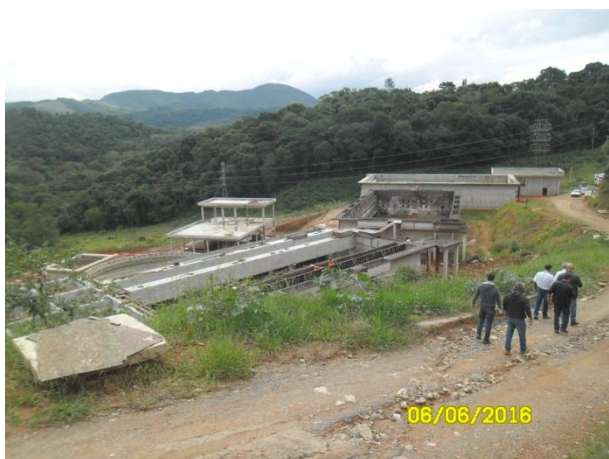
Foto 1 – Vista geral da ETE em primeiro plano UASB e tanques de Aeração.