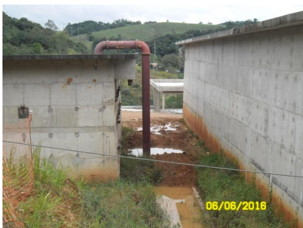
Foto 3 – Execução de obras: Reatores UASB – Upward-flow Anaerobic Sludge Blanket