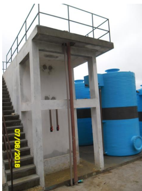
Foto 22 – Montagem dos equipamentos e conclusão das obras pendentes.