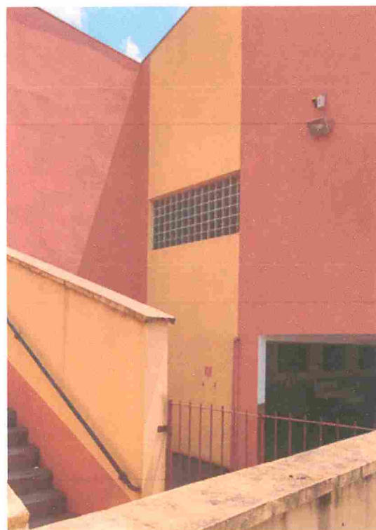
Espaço de acesso à EMEF Profª Carmen Lucia Blanco C. de Brito. PROTOCOLO Nº CETSUR 03/03/2022 - 11:13 2897/2022/lcl