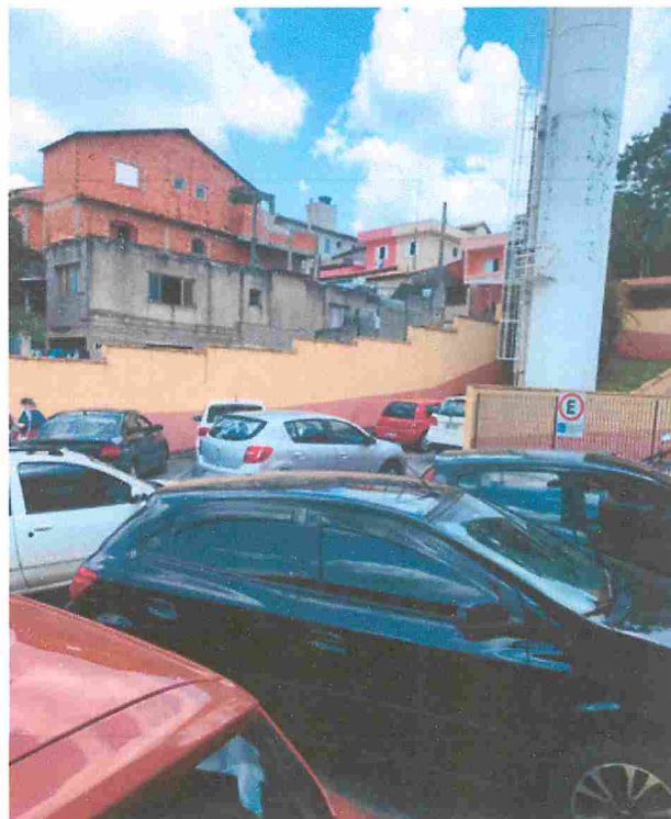
Estacionamento e via pública em frente à EMEF Prof a Carmen Lucia Blanco C. de Brito. PROTOCOLO Nº CETSUR 03/03/2022 - 11:13 2897/2022/lcl