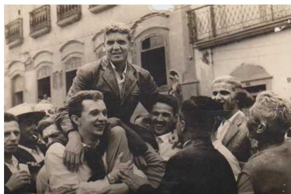
Registro da festa da vitória da campanha na Praça da Matriz

Conhecido no futebol como “Enxadão”, seu apelido serviu de nome a uma equipe fundada com o objetivo de auxiliar a divulgação do então jovem candidato na cidade, o Enxadão Futebol Clube. Tendo um senso de honestidade à toda prova, chegava a se “auto-expulsar” dos jogos quando achava que cometera um erro. A aclamação popular não demoraria a alçá-lo à Prefeitura: em 1960, com o lendário Vasco Barioni como vice-prefeito (esclareça-se que