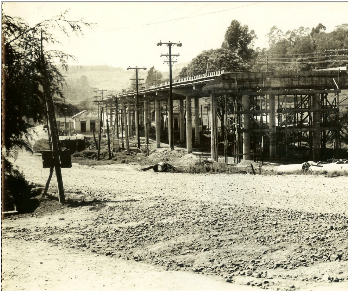
Viaduto da Raposo Tavares em Maylasky - Obra custeada pelo Governo do Estado - 1962