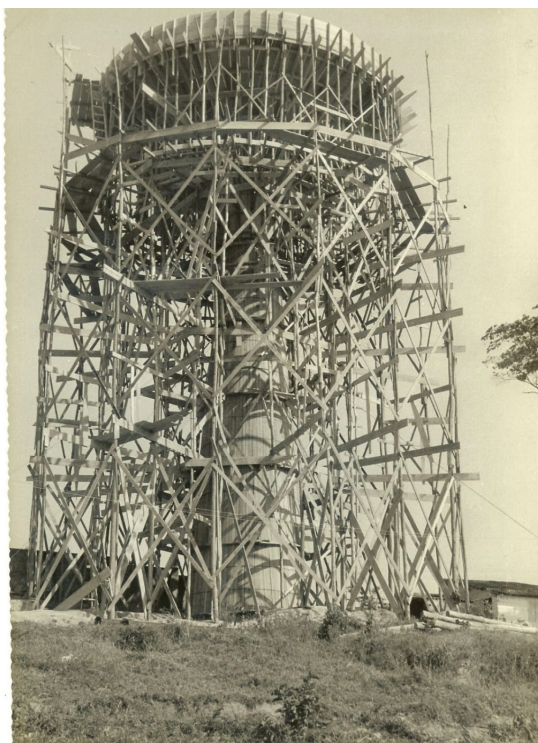
À esquerda, carta de despedida do primeiro mandato; à direita, o cálice (reservatório elevado de água com capacidade de duzentos mil litros), cujas obras se iniciaram em 1960 e foram concluídas em abril de 1961, e que permitia que a água chegasse aos pontos mais altos da cidade.