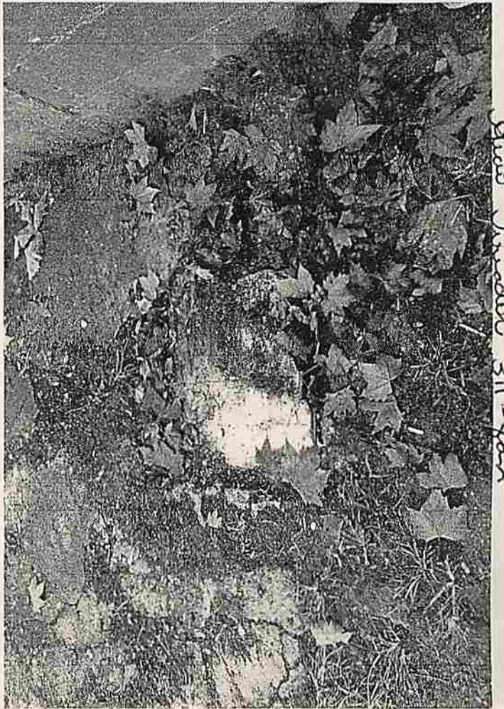
Slit's Junction 311 - Jan