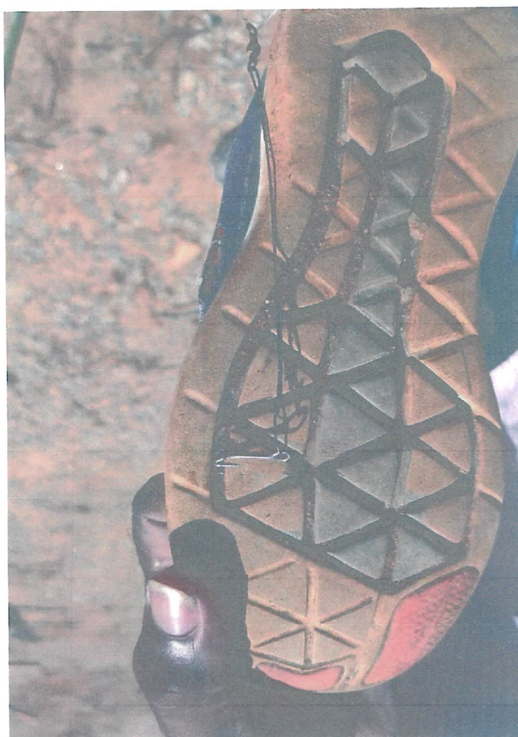
Problemas enfrentados pelos moradores

São Roque - 'A Terra do Vinho e Bonita por Natureza'