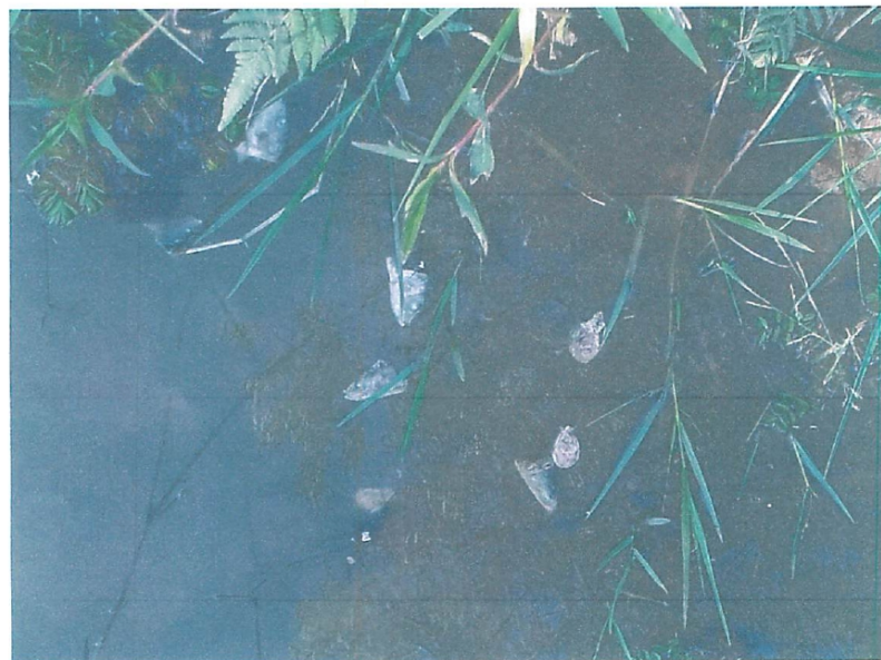
Armadilhas e lixo deixados no local