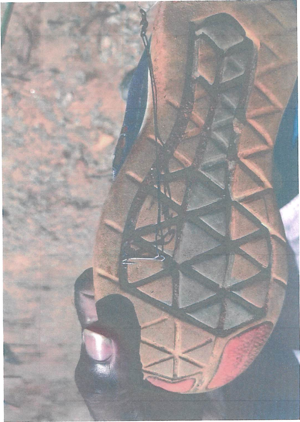
Problemas enfrentados pelos moradores