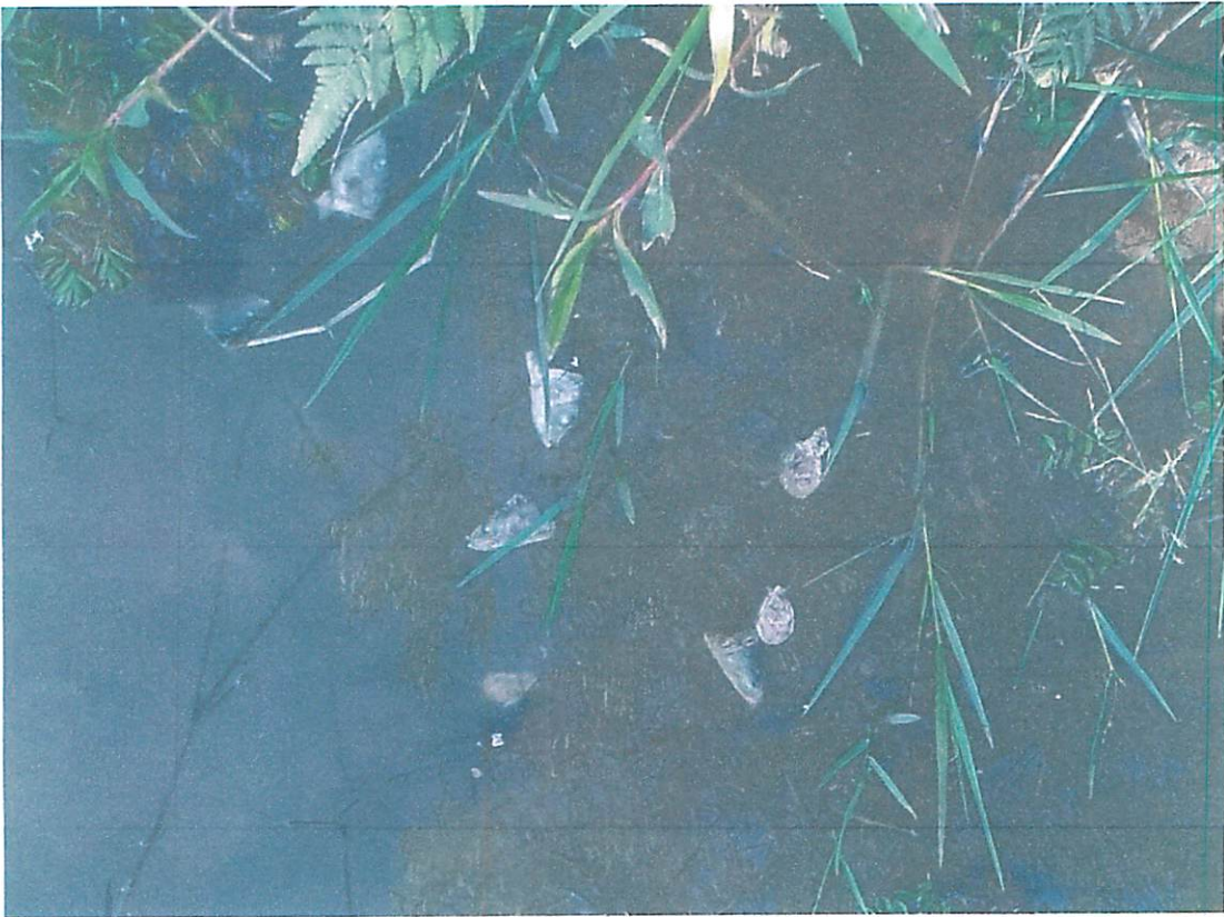
Armadilhas e lixo deixados no local